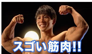
WEB 動画「ボディビルダー」篇より

* Johnson & Johnson, Inc. は光を調節する本タイプのコンタクトレンズを世界で初めて上市しました。