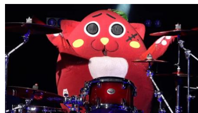
WEB 動画「ゆるキャラ」篇より