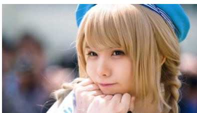
WEB 動画「コスプレイヤー」篇より