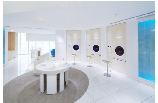
ビルトインタイプ

台 数：4台 (ラゲージタイプ1台、ビルトインタイプ3台) 所 要 時 間：15～20分 料 金：無料 ホームページ：URL: http://acuvue.jp/eyedefinestudio/